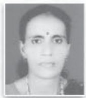
വൈ. പ്രസിഡണ്ട് ലൂസി പോൾ